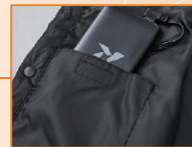
内側右裾にバッテリーポケット