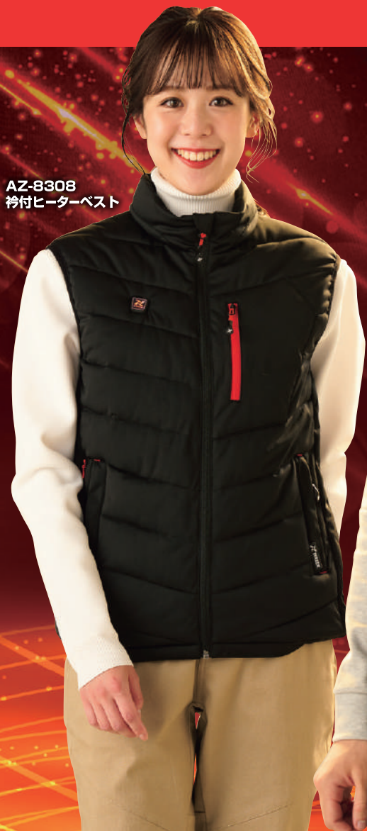
AZ-8308 長袖ヒーターベスト