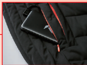
右脇にバッテリーポケット