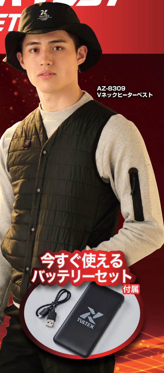
AZ-8309 Vネックヒーターベスト